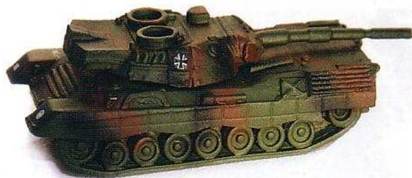
Leopard 1 A5 - Art.-Nr. BW-10 19,99