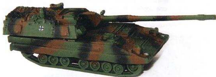
19,99 Panzerhaubitze 2000 - Art.-Nr. BW-11